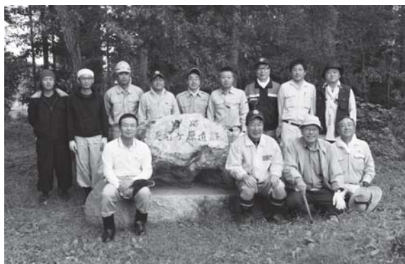
縄文の森草刈り集合写真

9:00～縄文の森草刈り作業をしました。 12:30～銭形大野店において例会を開催しました。