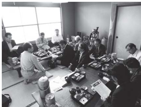
移動例会「銭形大野店」美味しいお弁当♪