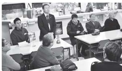
歩荷茶屋にて移動例会