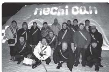
糸魚川中央 RC との集合写真