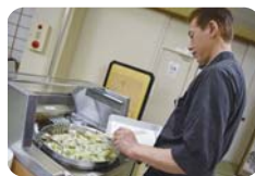
美味しそうなお肉と 天ぷらを目の前で調理♪