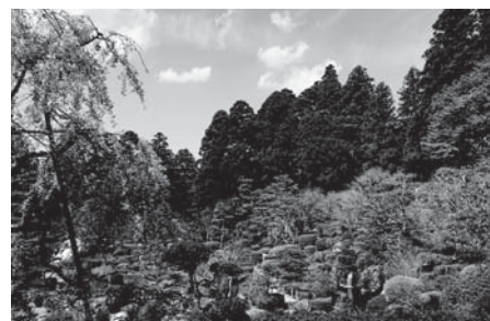
枝垂桜も綺麗に 咲いていました。