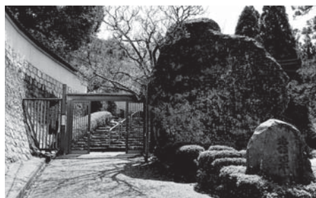
天気にも恵まれました☆