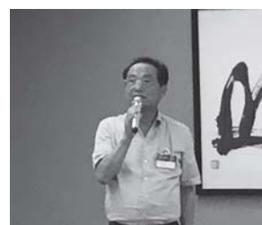
建部会長エレクトより締め挨拶