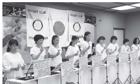
『ベルリングガールズの皆さん』 ハンドベルの素敵な音色☆