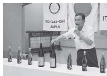
黒電興業(株)さんから謙信と立山をいただきました♪ 「ありがとうございます☆」