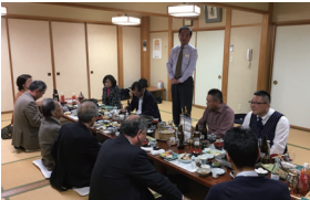
建部会長エレクトより締め挨拶