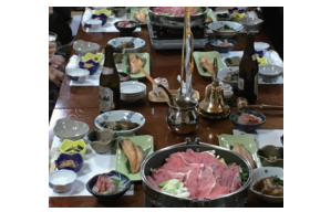
相変わらず食べきれない程の料理でした♪