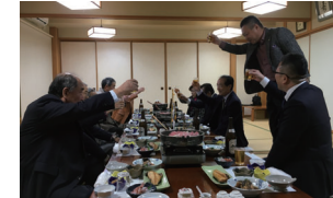
猪又会長より乾杯☆