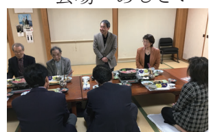
小田島プログラム委員長挨拶