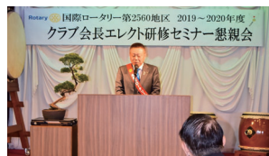
猪又会長歓迎の挨拶